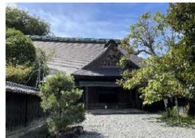
江川家住宅「江川邸」