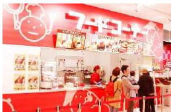
めんたいパーク伊豆

*山中城址公園(三島市) 北条氏が対豊臣用として要塞化した山城。小田原征伐の緒戦に落城。