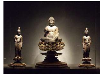
かなみ仏の里美術館